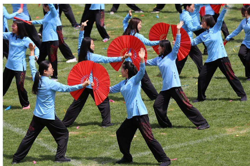
数院教工在太极扇表演中

由于降雨影响，原定于 4 月 21 日上午举行的团体太极扇表演移至 4 月 24 日中午举行。当天艳阳高照，但数院教工斗志昂扬。位居舞台中心位置的他们身着天蓝色练功服装，精神抖擞地大步进入操场。在碧绿的草坪上，在柔美的音乐中，老师们将每个太极动作一气呵成地操练下来，将手中的红扇舞得行云流水、虎虎生风，为北京大学一百二十周年校庆献上了自己最出色的表演。