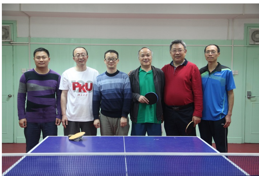
数院一队与基建工程部队赛后合影留念