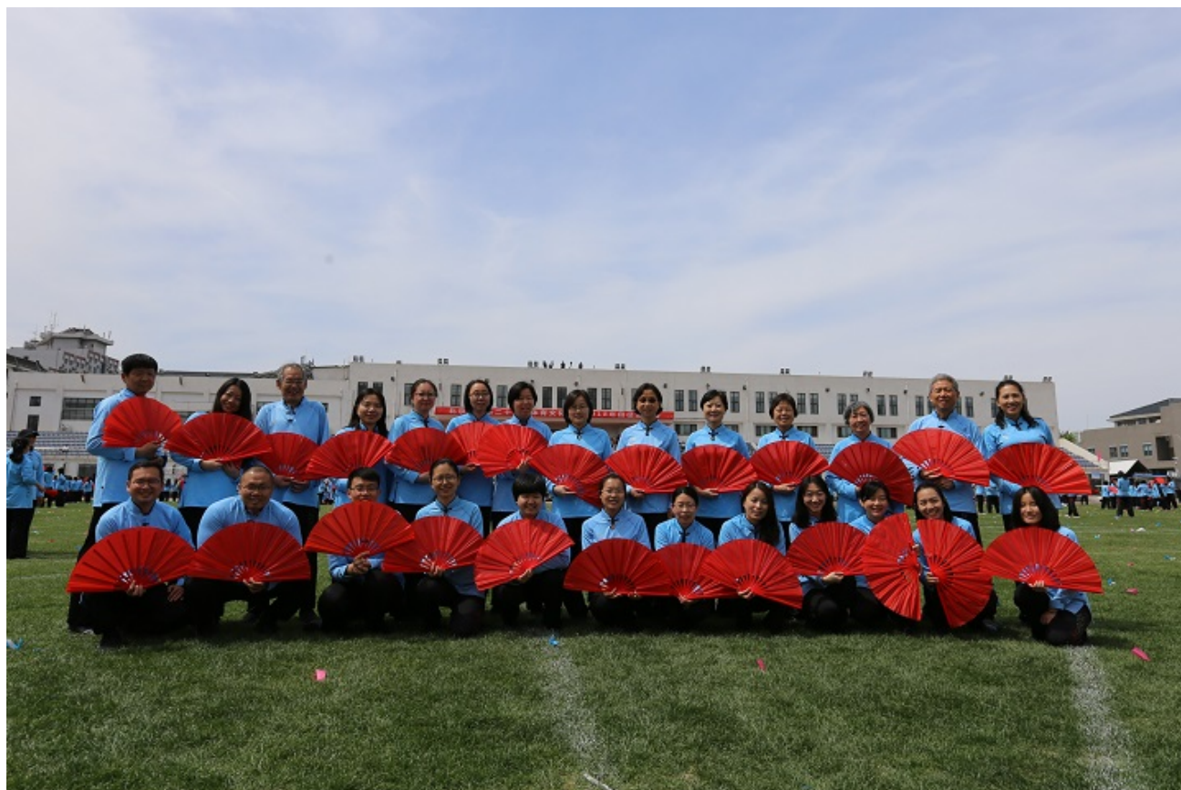
数院太极扇参演队员合影

2018 年 4 月 20 日、27 日，北京大学教工运动会在五四体育场举行。数学科学学院工会积极组织教职工参赛。赛场上，数院健儿们力争上游，奋勇拼搏，最终取得团体总分 90.5 分的不俗战绩。