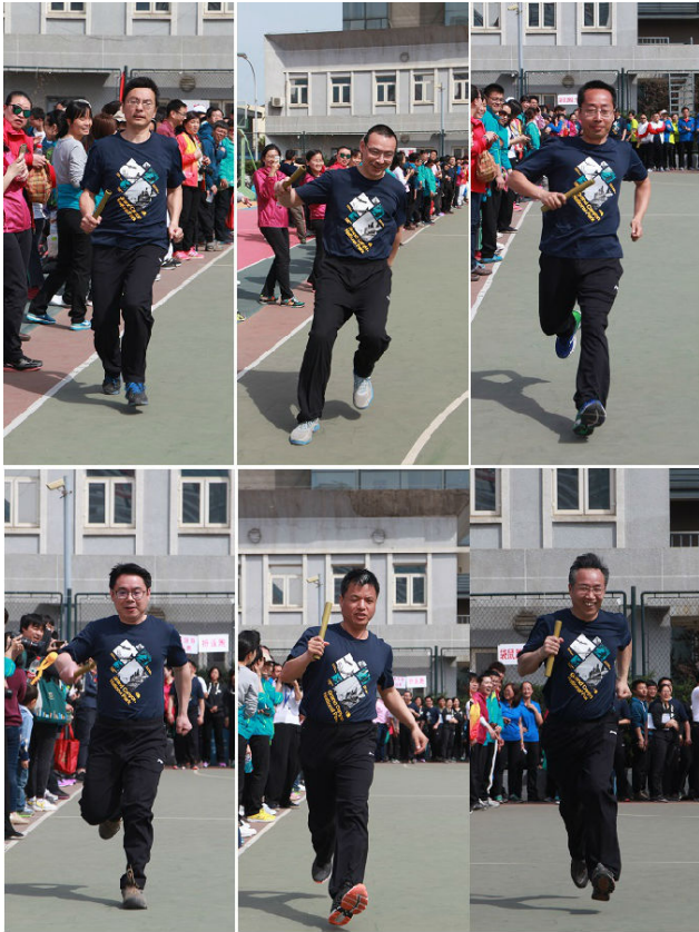
数学科学学院参加 系处级领导干部趣味折返跑接力赛