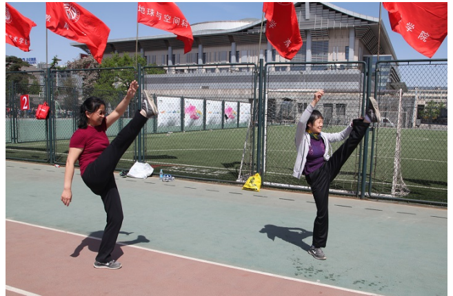
女子 D 组立定跳远赛前热身

8 个团体项目，并且在 3 个项目中获得了名次积分。团体项目上的斩获加上个人项目中名次含金量的提升，使得数学学院的最终总分比去年增加了 12 分，成功完成了超越自我的既定目标。