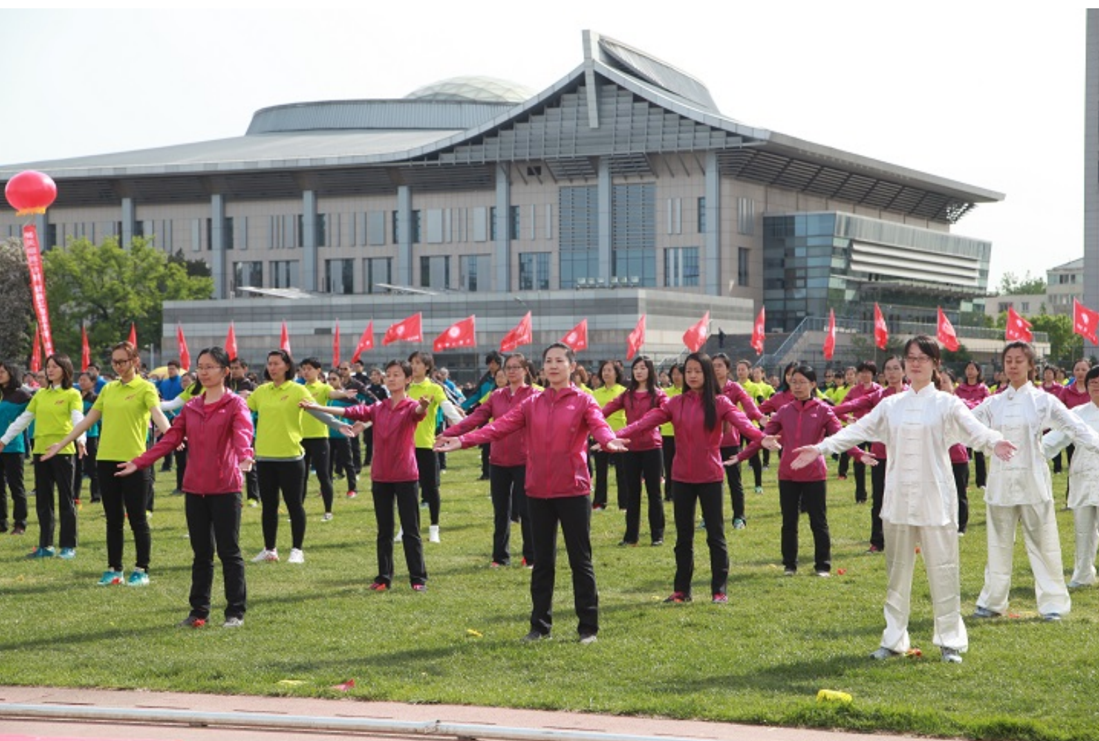
数学科学学院参加团体操“五禽戏”表演

2016年4月22日至23日，2016年北京大学教工运动会在五四体育场举行。数学科学学院工会积极组织教职工参加本次赛事，充分发挥了水平，共有10人次、1个接力项目和3个