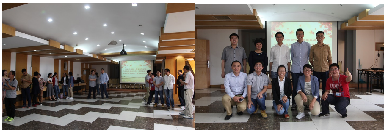
迎新会现场/部分新入职教工合影

本年度数学科学学院共迎来16位新入职教职工，其中2位教员、9位博士后、4位职员、1位选留学工。会议采用茶话会形式。各位新老师通过简单的PPT向大家介绍了自己的教育背景、研究方向、工作范畴和兴趣爱好，以及对在数院工作生活的憧憬。诙谐幽默的发言激起现场阵阵欢笑。之后各位老师就彼此关心的话题展开了热烈的交流互动，新人们则借机向前辈们请教工作经验。