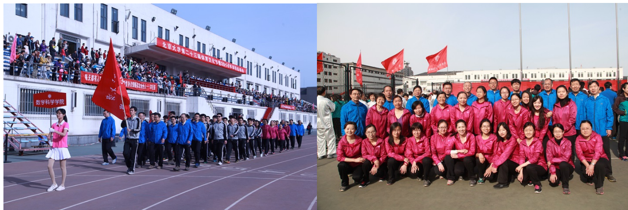
数学科学学院代表队入场/团体操成员合影

团体项目闯入前八名，另有 18 人次、2 个接力项目和 5 个团体项目拿到参与积分，最终取得 102.5 分的不俗成绩。