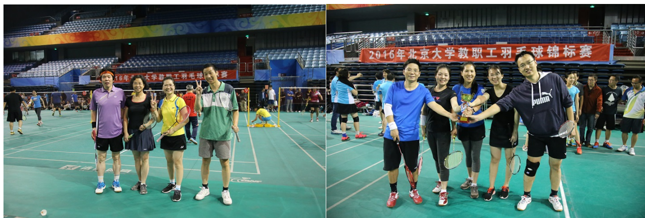
数学一队/二队队员合影

略显遗憾的是，四分之一决赛中，数学二队碰上了最终的乙组冠军物理二队，女双虽然竭尽全力，但没能弥补实力差距而告负。男双则暴露了配合欠熟练的问题，在个人实力相当的情况下，未能抵挡住对方的默契配合，“只差一步到罗马”无缘升级甲组。不过在10月13日的排位赛中，数学二队再取两连胜。乙组第五名的里程碑战绩令全体数学人欢欣鼓舞，也让大家对来年的比赛充满了期待。数学二队队员们有了复赛的初体验，开阔了比赛眼界，同时也更清醒地认识到了自己在技术和配合上的不足，未来将在有针对性的练习中弥补与强化相应环节。